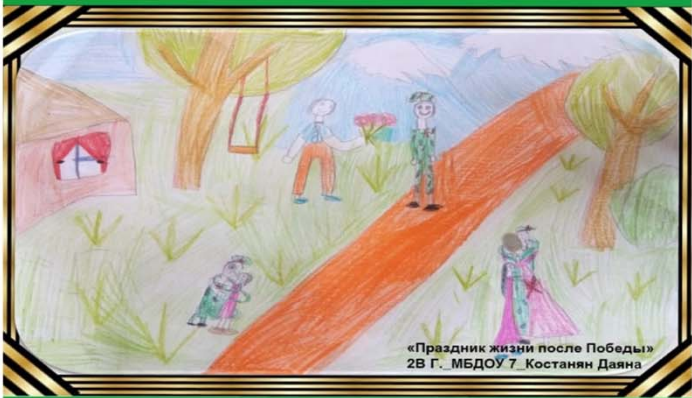
«Праздник жизни после Победы» 28 Г. МБДОУ 7 Костанян Даяна